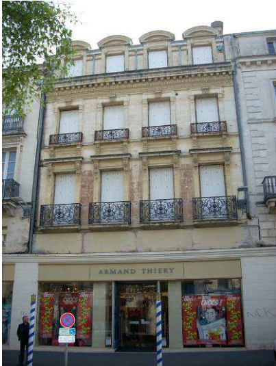
La spirale de la vacance des étages au-dessus des commerces