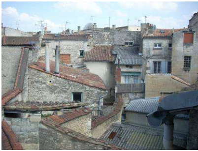
Ville de Niort - Subvention de l'OPAH RU - Usat Poitou - L'OPAH/RS/2010/1/1 - 2 sur 3 BILAN DES 3 ILOTS